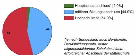
Ausbildungsbereich öffentlicher Dienst