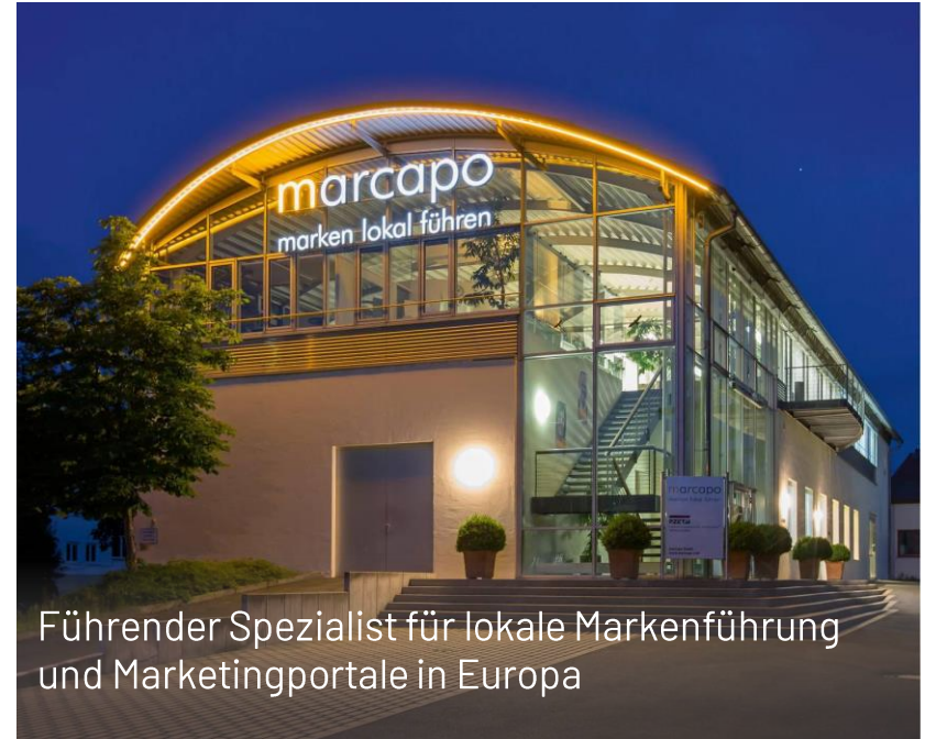
Führender Spezialist für lokale Markenführung und Marketingportale in Europa